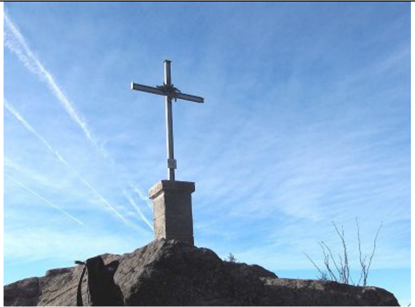
Gipfelkreuz am Breitenauriegel

Vom Breitenauriegel aus folgt man den Wegweisern zur Oberbreitenau und Landshuter Haus. Im bewirtschafteten Landshuter Haus kann nun eine ausgiebige Pause eingelegt werden. Der rund 6 Kilometer lange Rückweg zum Einstiegspunkt Ruselabsatz führt über den Wanderweg Nr. 2 über die "Hölzerne Hand".